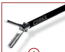
5 C-GRASP 18mm Maullänge