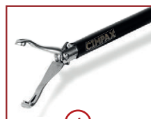
4 C-BAB 22mm Maullänge