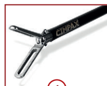
6 C-GRASP 22mm Maullänge